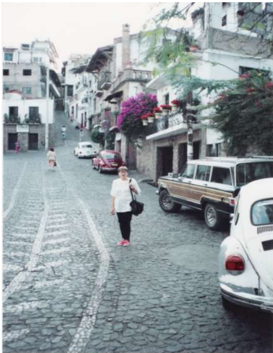
Рудник сребра Таско